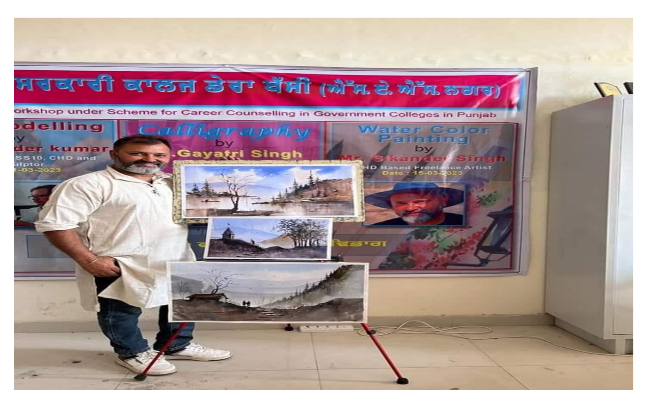
Workshop regarding "Calligraphy"By Fine Arts Department