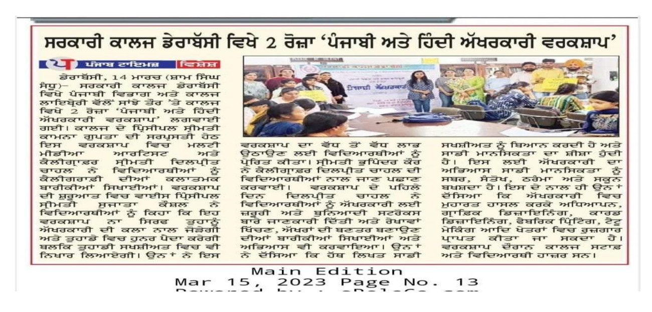
Workshop regarding "Punjabi & Hindi Akhrkari" by Punjabi and hindi Department