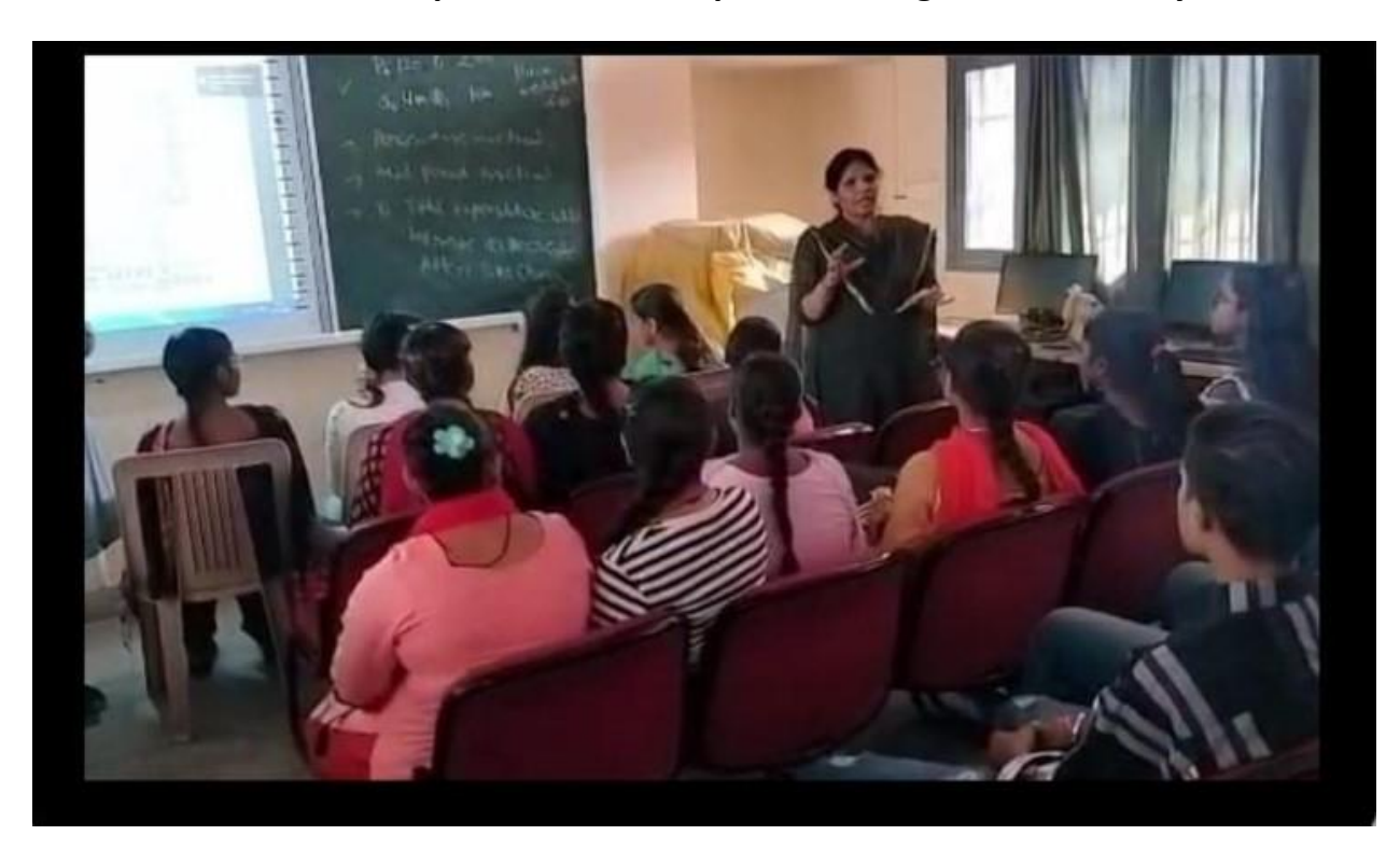
2Nov.,2022-Computer Science Department organized One day seminar